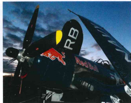
2100 PS im Abendlicht – Red Bull Corsair

Diesmal hatte das Wetter – bis auf einen halben Tag Woodstock-Feeling am Samstag – ein Einsehen mit der stets wachsenden Zahl der Tannkosh Fangemeinde. So waren bis Freitag schon knapp 1 000 Flugzeuge angereist und selbst am Sonntag, dem letzten Tag, machten sich noch Piloten auf ins Allgäu. Am Ende waren es 1481 angereiste