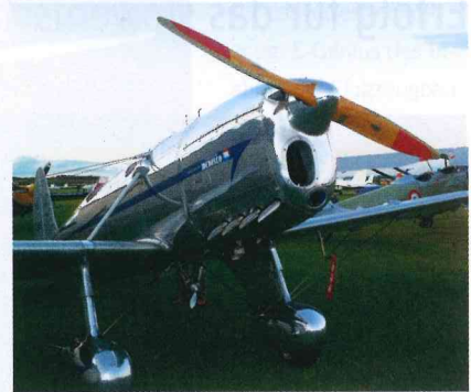
Ryan Sta Special von 1937