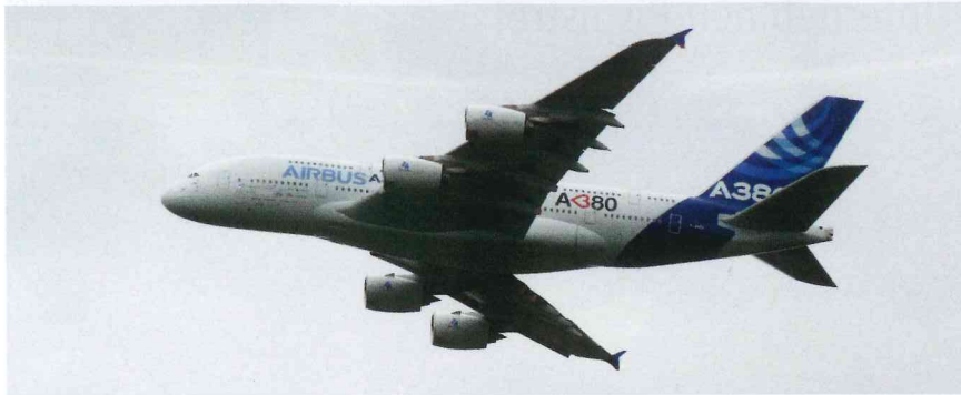
Star im Flying Display – Airbus A380

Diesmal hatte das Wetter – bis auf einen halben Tag Woodstock-Feeling am Samstag – ein Einsehen mit der stets wachsenden Zahl der Tannkosh Fangemeinde. So waren bis Freitag schon knapp 1 000 Flugzeuge angereist und selbst am Sonntag, dem letzten Tag, machten sich noch Piloten auf ins Allgäu. Am Ende waren es 1481 angereiste